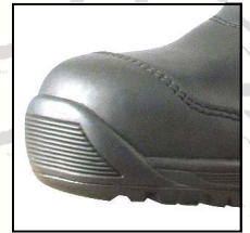
Резиновая накладка на носке